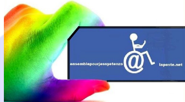
Ensemble pour Jessy et Enzo